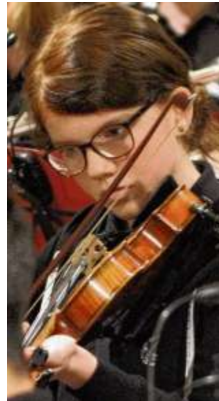
Hochkonzentriert: Das EGW-Schul-Orchester.

nale noch eine besondere Überraschung aufgehoben. Bevor es allerdings so weit war, genossen die Gäste in der voll besetzten St.-Jacobi-Kirche die fröhlichen Weih-